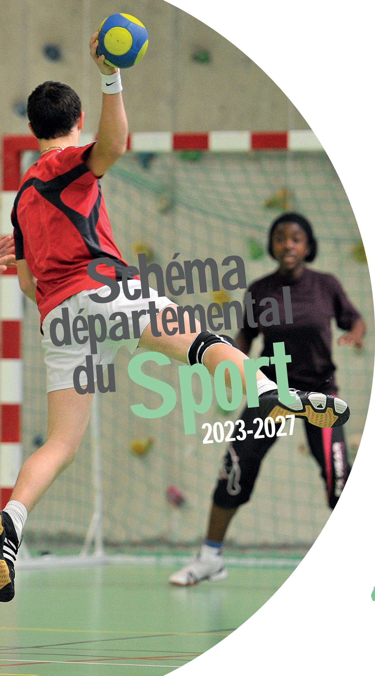
Schéma départemental du Sport 2023-2027