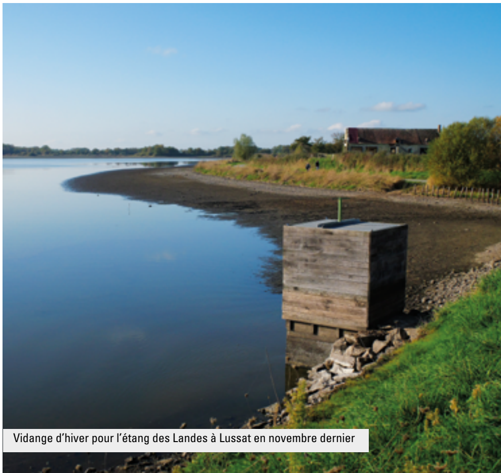
Vidange d'hiver pour l'étang des Landes à Lussat en novembre dernier