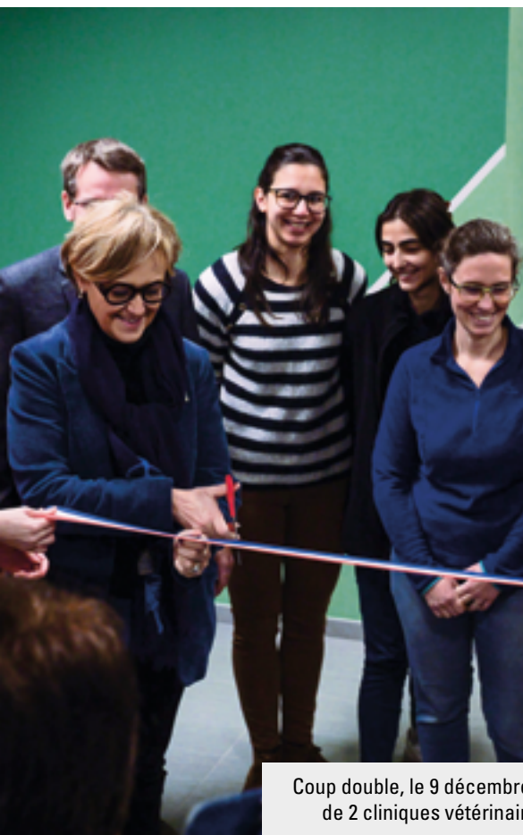
Coup double, le 9 décembre dernier, avec l'inauguration de 2 cliniques vétérinaires à Aun et Bourgneuf